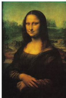
Mona Lisa Leonardo da Vinci