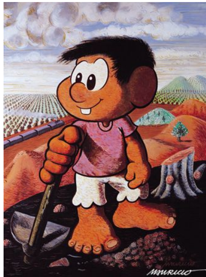
Chico Lavrador de Café, 1989 acrílica sobre tela, 113 x 93 cm